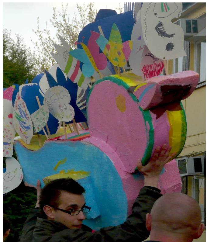
Ptaka zrobiony przez dzieci w Ośrodku dla Uchodźców w Warszawie

Wszystkim dzieciom oraz wychowawcom, którzy przyczynili się do powstania tych pięknych ptaków serdecznie dziękujemy!