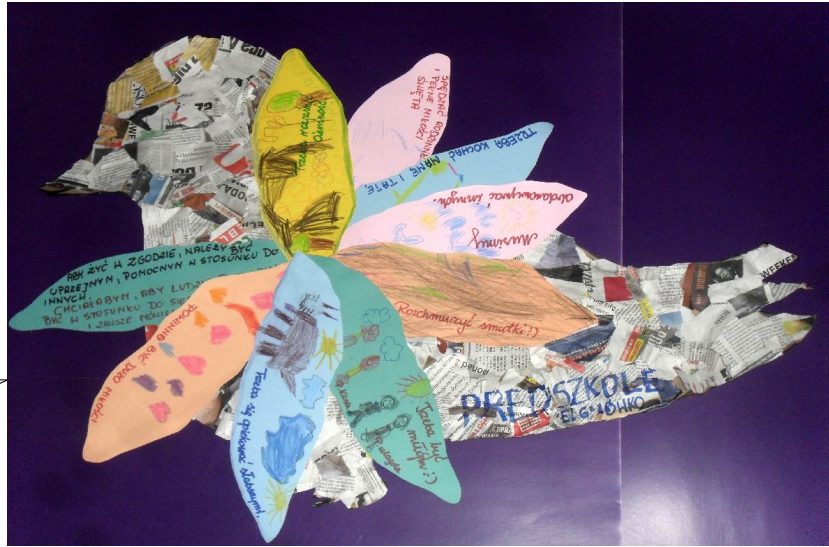
Ptaka nr 1 z przedszkola w Elgnówku

W ostatnim liście Taponi przesłaliśmy Wam, drogie dzieci propozycję zrobienia polskiego Ptaka Pokoju i Przyjaźni . Chcielibyśmy teraz podzielić się z Wami zdjęciami ptaków, które zrobiły dzieci z przedszkola w Elgnówku oraz z ośrodka dla uchodźców* w Warszawie. Co o nich sądzicie? Jeśli spodobały się Wam, zachęcamy do stworzenia waszego własnego Ptaka Pokoju. Nadal możecie nam je wysłać!