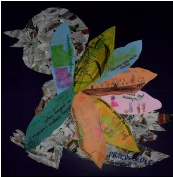
Ptaka nr 2, który przyleciał do nas z przedszkola w Elgnówku