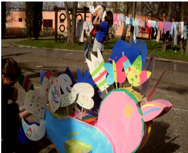
Ptaka zrobiony przez dzieci w ośrodku dla Uchodźców w Warszawie

W ostatnim liście Taponi przesłaliśmy Wam, drogie dzieci propozycję zrobienia polskiego Ptaka Pokoju i Przyjaźni . Chcielibyśmy teraz podzielić się z Wami zdjęciami ptaków, które zrobiły dzieci z przedszkola w Elgnówku oraz z ośrodka dla uchodźców* w Warszawie. Co o nich sądzicie? Jeśli spodobały się Wam, zachęcamy do stworzenia waszego własnego Ptaka Pokoju. Nadal możecie nam je wysłać!